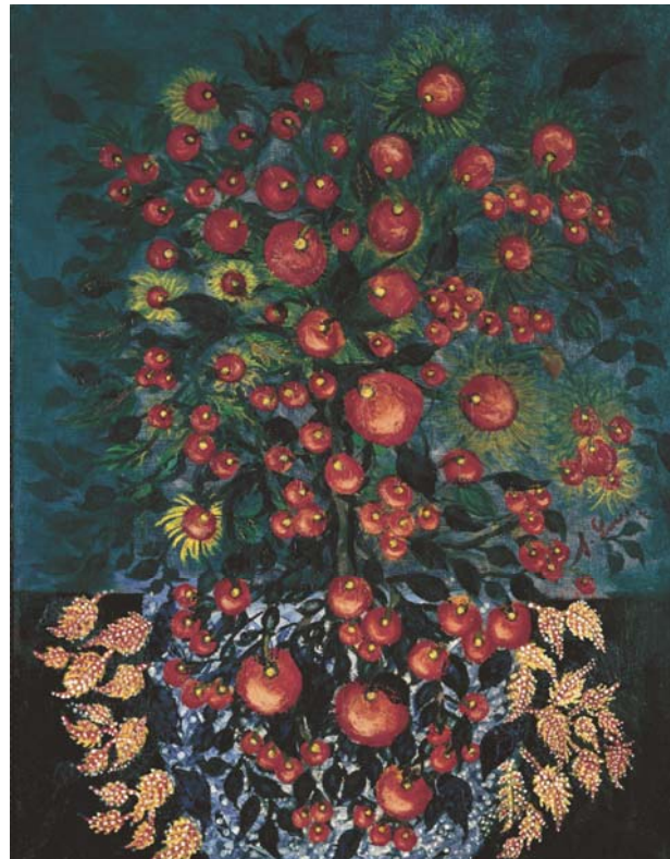
Pommes aux feuilles, 1928-1930 Huile sur toile, 116 x 90 cm