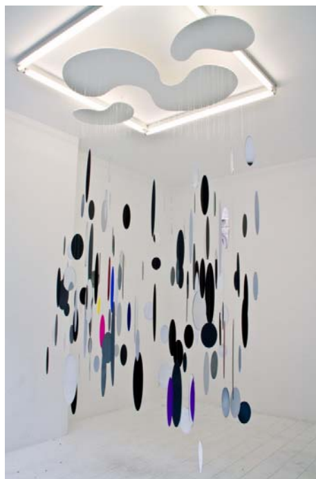
Révolutions 15 190 x 130 h 270 cm 2011, plexiglass, nylon, peinture et bois Guestroom Gallery, Bruxelles 2011