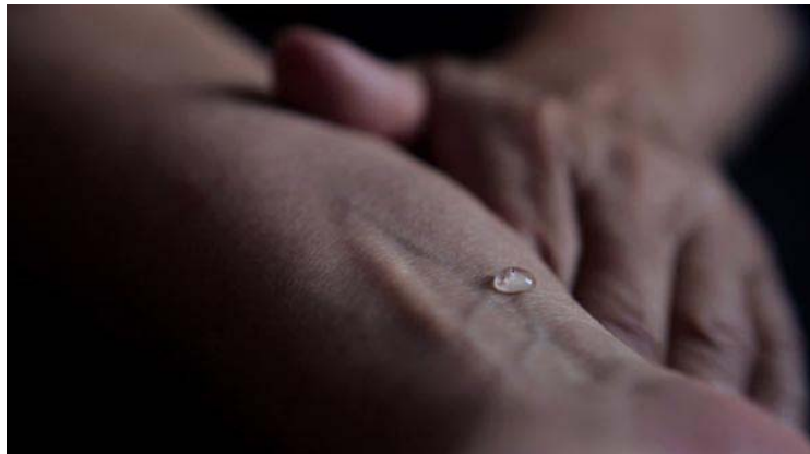
Ligne , vidéo HD, 1 min en boucle, 2011.