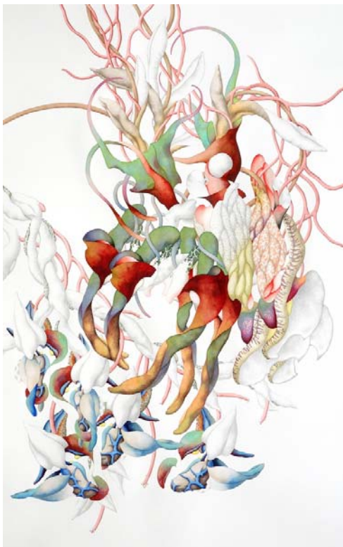
As You Desire Me diptych 1-2, 2011, 140x87 cm