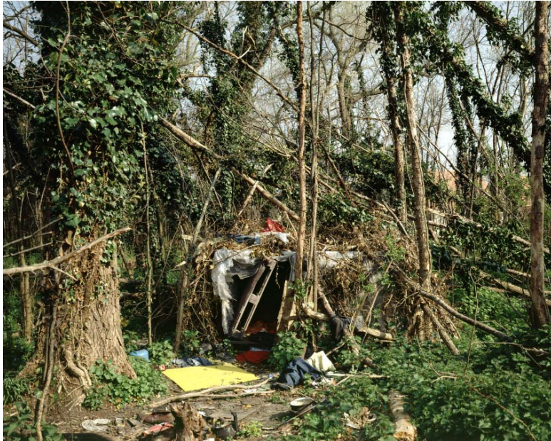
Abri # 6, Calais, avril 2007, 2007 Collection du Fonds régional d'art contemporain Île-de-France © Bruno Serralongue et Air de Paris