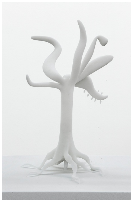
Arbre 2008 frittage de poudre coll.privée