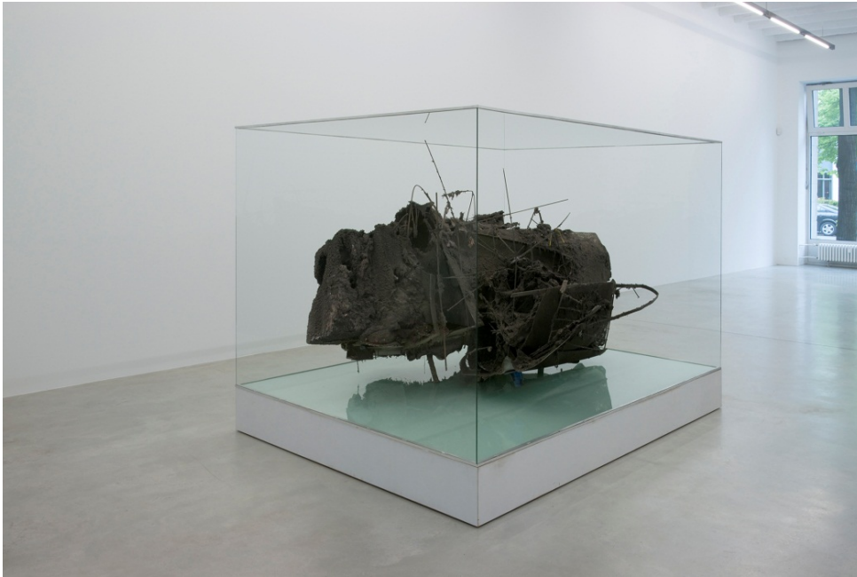
Peter Buggenhout The Blind Leading The Blind #36 , 2010 Sculpture: 145 x 185 x H 125 cm Technique mixte.