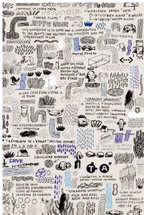
Dessins extraits de la série : "Branchages", 2002 - 2008 27 x 20 cm Technique mixte sur papier