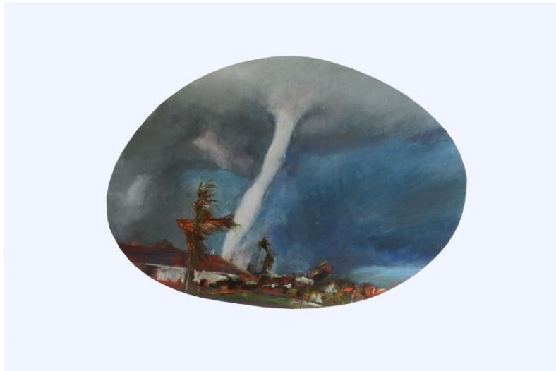
Tornades 2 Huile sur papier. 120X80cm