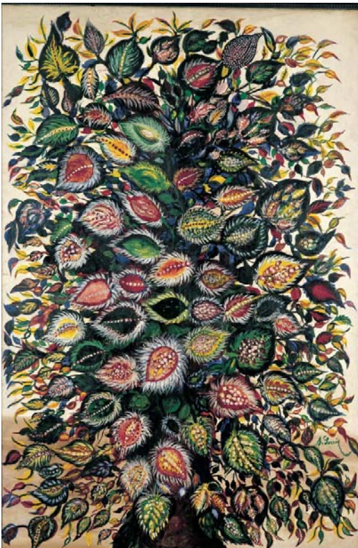
Feuilles, 1928-1929 Huile sur toile, 195 x 130 cm