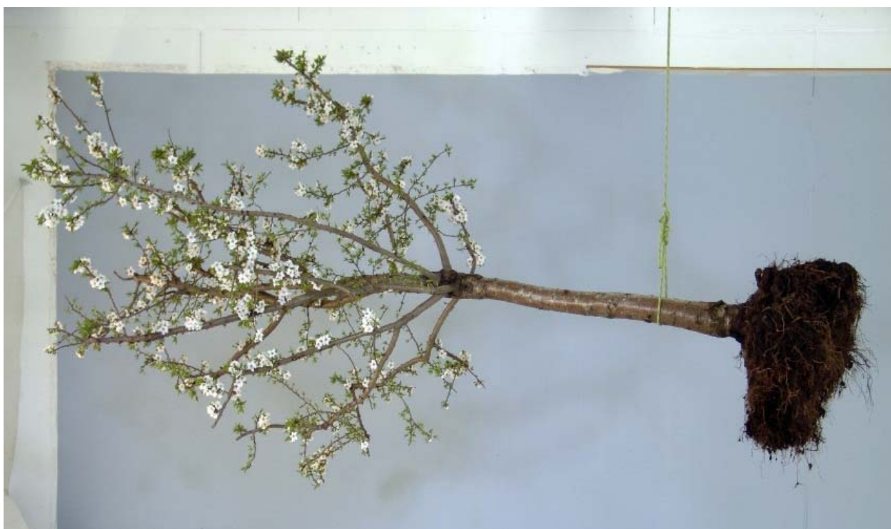
Jean-Claude Ruggirello, Jardin , 2006

Exposition collective 15 février – 28 juillet 2013