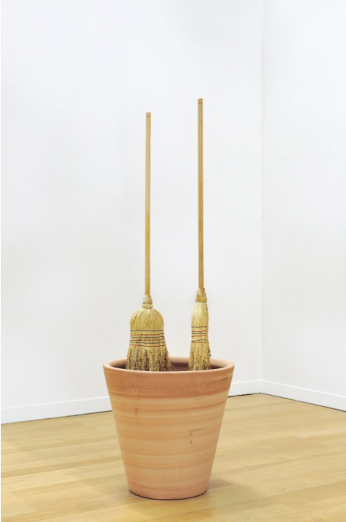
Sans titre , 2012, balais sorgho, pots en terre cuite et terre, 210 x 50 x 50 cm. Courtesy Art: Concept Photo: R. Fanuele