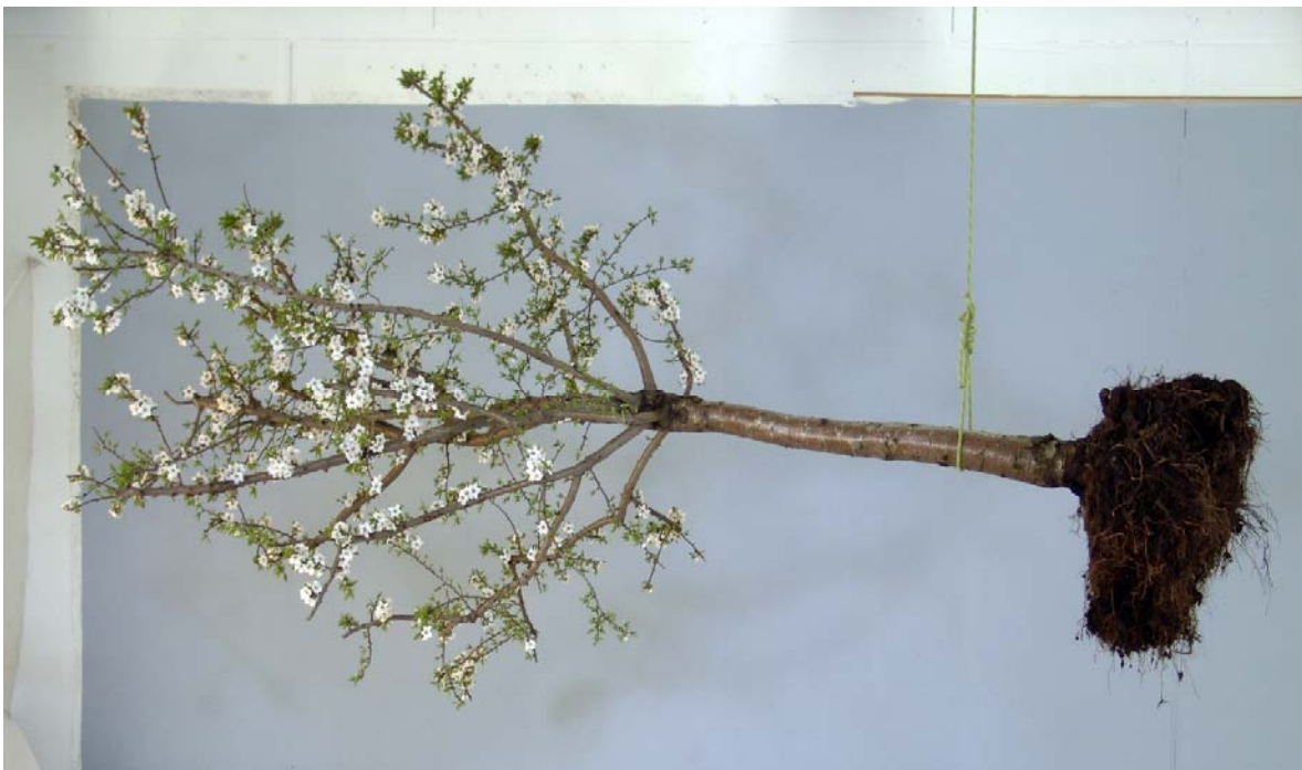
Jardin 2006