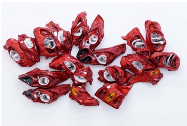
Sans titre , 2012 Phares de voiture 120 x 170 x 20 cm