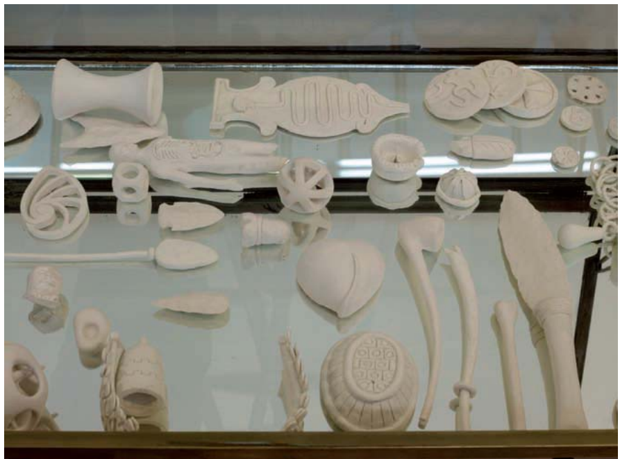
Arabesques Rarities , 2010 Détails argile et papier mâché (146 x 105 x 236 cm)